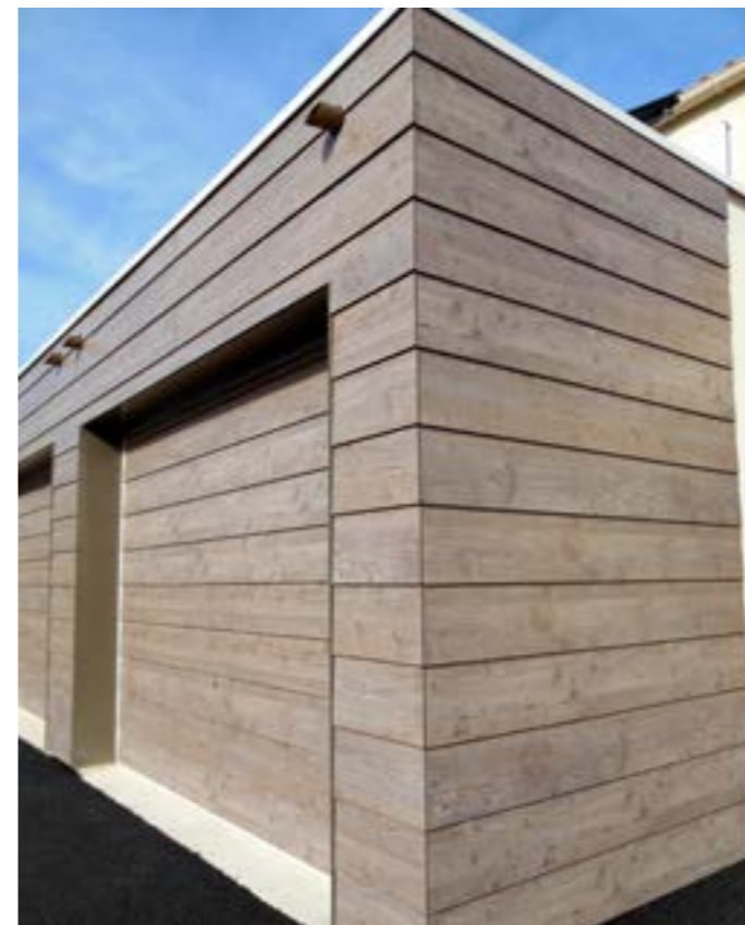
ARCHITECTE: MAP ARCHITECTURE

Nous fournissons des lames Clins coupées à dimension (côtes finies), à partir de notre gamme de décors issue du nuancier Max Exterior, soit plus de 120 décors (Colour – Metallic – Nature – Material – Authentic).