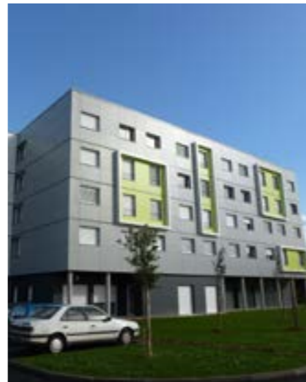
ARCHITECTE: SOURD DURAND

Autres revêtements: Polyester 25 µ, Polyuréthane 35 µ, PVDF 25 µ, etc.. Teintes suivants le nuancier Monopanel