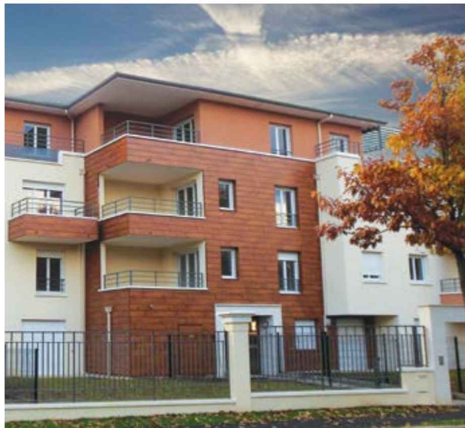
ARCHITECTE: DT ARCHITECTES