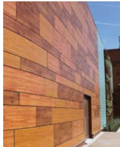
ARCHITECTE: DT ARCHITECTES

métalliques munie d'une bande EPDM adhésive 1 face (à disposer entre la tôle pare pluie métallique et l'ossature support de panneaux de bardage) solidarisée aux lèvres du plateau au moyen de vis entretoise SFS ou Etanco. - Les revêtements extérieurs de façades ou bardages rapportés ventilés Max® Exterior, Max® Universal, constitués de panneaux HPL fixés par rivets, ou agrafes seront sous Avis Technique CSTB ME08 FR ou ME03 FR Clins.