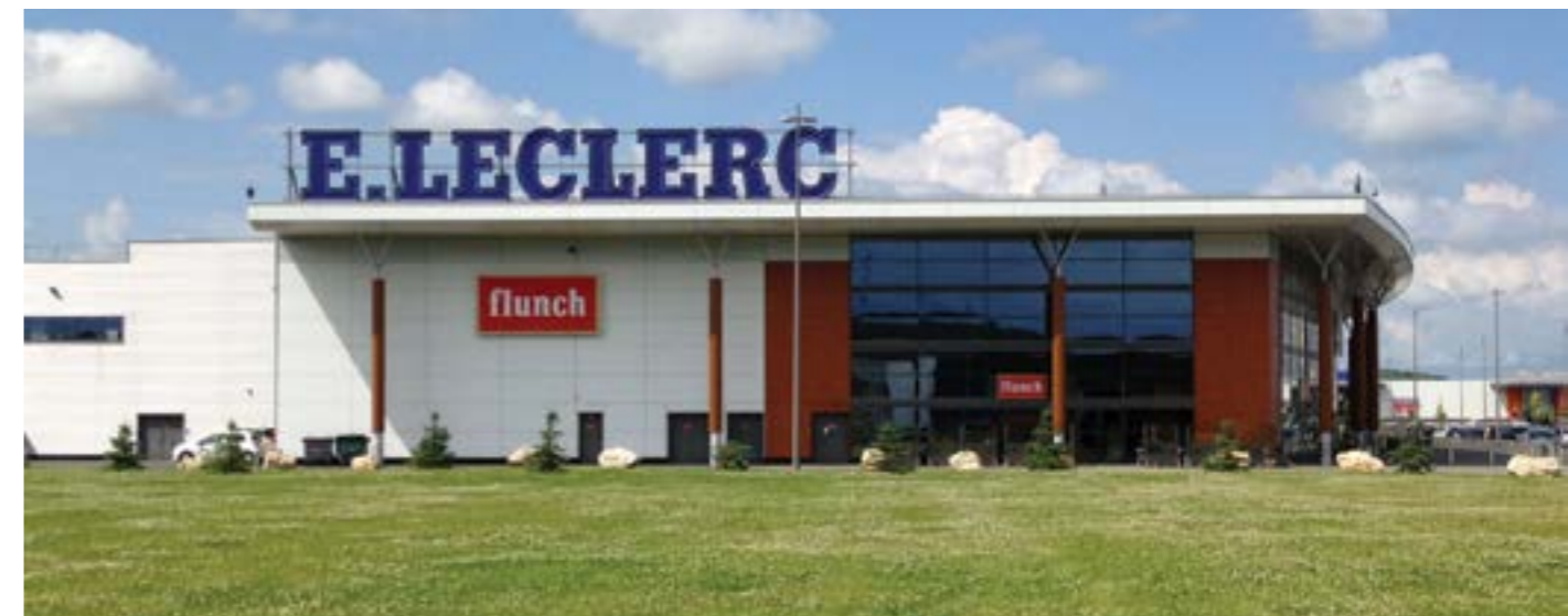
ARCHITECTE: BOUTET ET DESFORGES

Le système ME06 FR (hors cas de la double couche d'isolant) peut être mis en œuvre sur des parois verticales d'ouvrages de type I, II, III et IV en zones de sismicité 1, 2, 3, 4 en respectant les prescriptions énoncées dans l'Annexe F de l'Avis Technique ME06 FR.