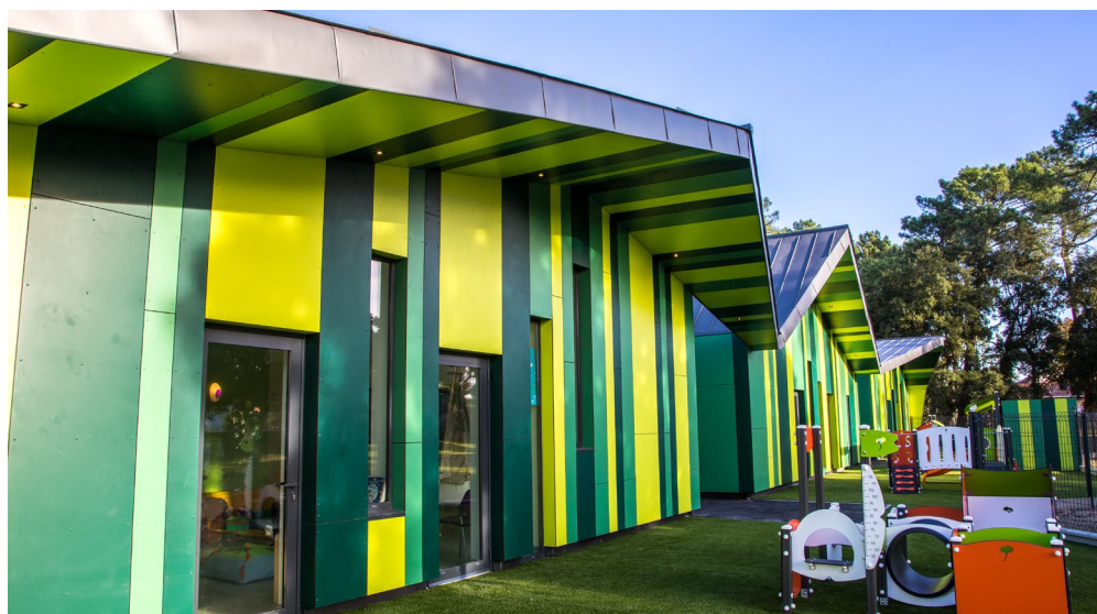
ARCHITECTE : TWO ARCHITECTES

Pose sur 3 appuis et plus a = 600 mm maxi (voir AT ME08 FR) b = 600 mm maxi (voir AT ME08 FR)